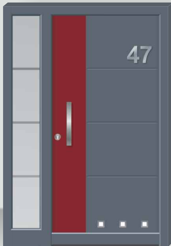
Modell HT 845-NE